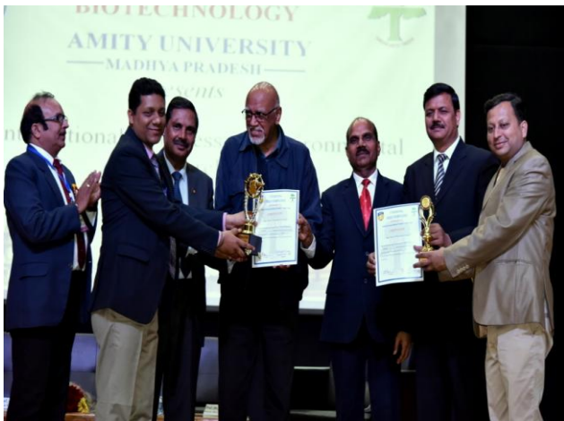
Dignitaries giving Best Presentation Awards