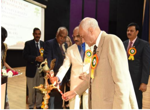
Lightening of the lamps by dignitaries