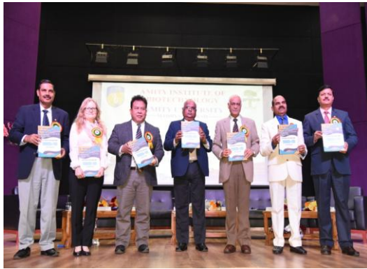
Release of Abstract book by the Dignitaries on the Dais