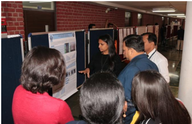
Evaluation of posters by esteemed Judges