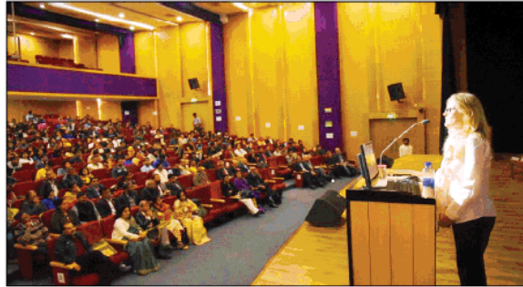
एमिटी यूनिवर्सिटी में 9वीं अंतरराष्ट्रीय कांग्रेस को संबोधित करती विदेशी अतिथि।