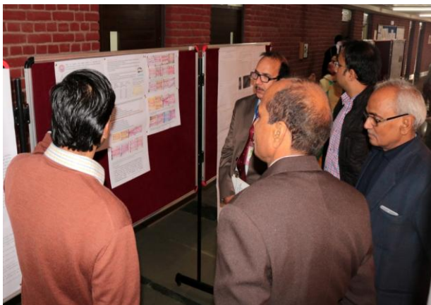
Evaluation of posters by dignitaries