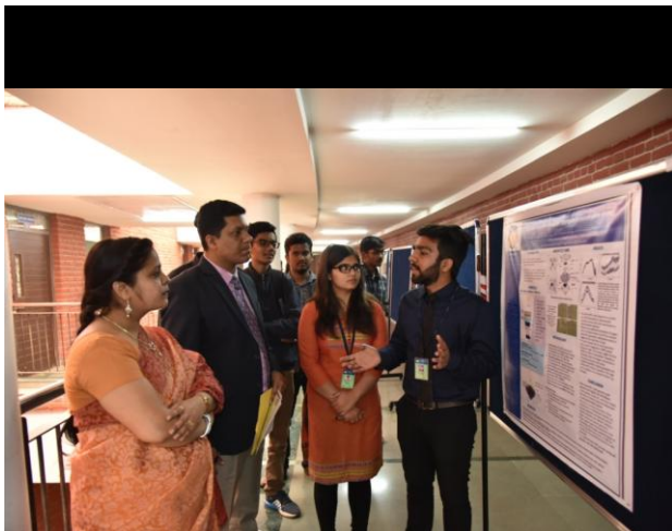
Poster evaluation by esteemed judges