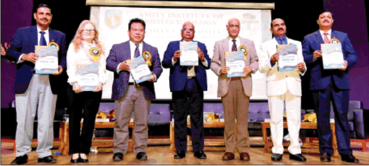
एमिटी यूनिवर्सिटी में गार्गारण विषय पर आयोजित 9वीं अंतरराष्ट्रीय कांग्रेस के शुभारंभ अवसर पर गत्रिका का तिमोचन करते अतिथिगण।